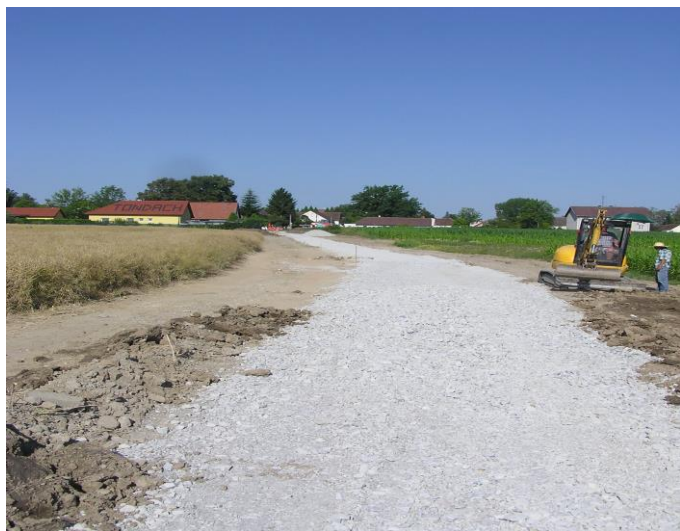
Komunikace před dokončením

Probíhající práce: Probíhá betonování štěrbinové nádrže, komunikace je před konečnou úpravou šotolinou, je ukončen napouštěcí objekt rybníka Potockého, budou probíhat práce na biologické nádrži (oplaštění stěn nádrže, propojovací potrubí ČOV...).