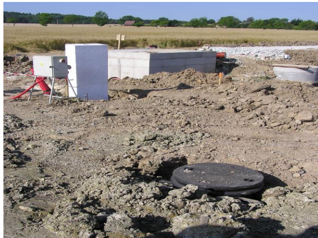
Vodoměrná šachta, rozvodný pilíř elektřiny